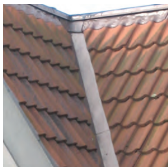
QuiTex R auf altem Traufblech, Kehlblech und Bleischürze mit Colorfinish

Alte Rinnen werden fast wie neu, neue erhalten eine deutlich verlängerte Lebensdauer.