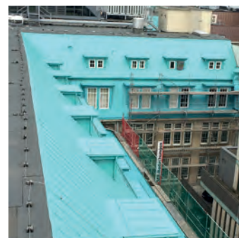
QuiTex R auf einer alten Metallmansarde zzgl. Colorfinish