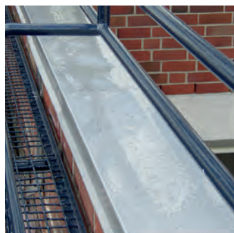
QuiTex R auf einer alten Mauerabdeckung